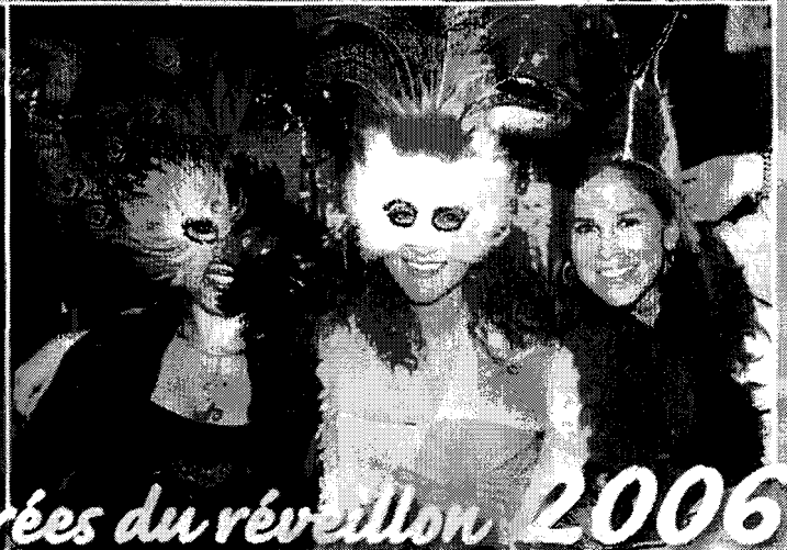
Flash sur les soirées du réveillon 2006!