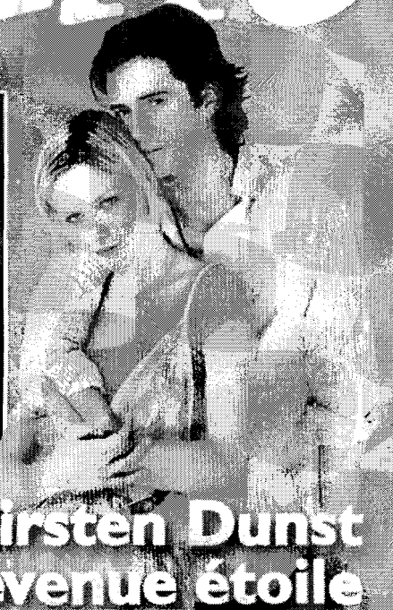
Kirsten Dunst L'enfant star devenue étoile