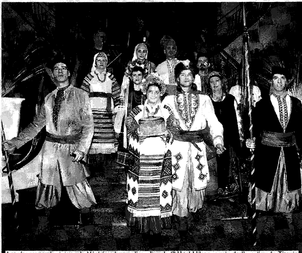
Les danseurs ukrainiens de Véchévanka sur l'escalier de l'Hôtel Hilton, copie de l'escalier du Titanic

Auparavant un week end emmena les participants dans des lieux de prestige parisiens comme le Cercle Suédois, l'Hôtel Bristol, le Costes, le Mandalaray, mais aussi le Centre Culturel Ukrainien (ancienne résidence d'Alain Delon et Romy Schneider), à la rencontre d'artistes contemporains de