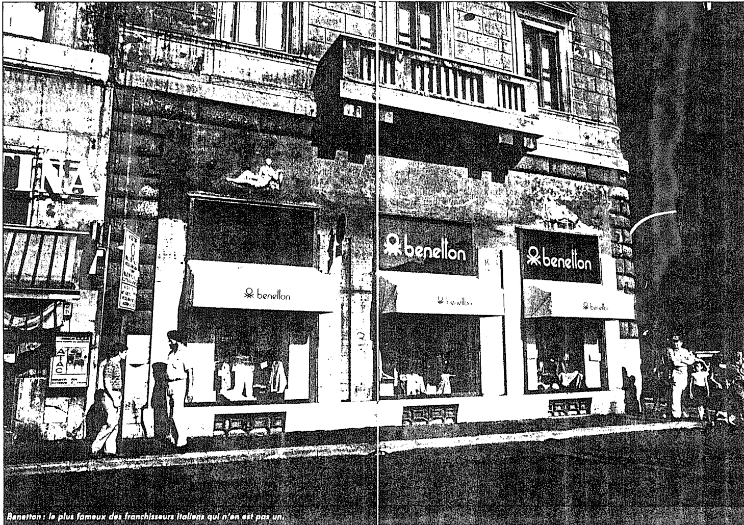
Benetton : le plus fameux des franchiseurs italiens qui n'en est pas un.

A conseiller pour : les opérations de prestige. (Source : Olivier Gast - Cabinet Gast Douet).